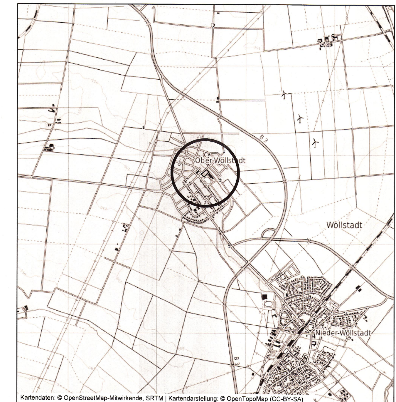
Übersichtskarte (Maßstab 1 : 25.000)