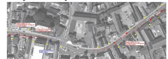
Planungsentwurf Frankfurter Straße