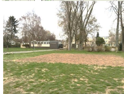
Hallenstandort südl. Fritz-Erler-Grundschule

Variante 2, 3-Feldhalle mit direkter baulicher Anbindung an die Schule